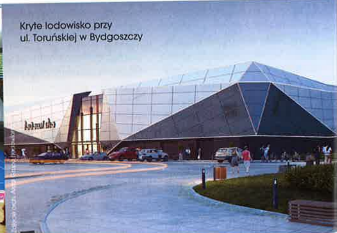
Kryte lodowisko przy ul. Toruńskiej w Bydgoszczy