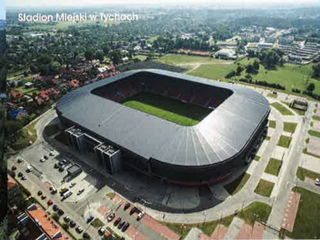
Stadion Miejski w Tychach