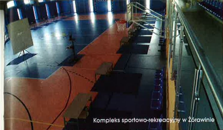
Kompleks sportowo-rekreacyjny w Żorawinie