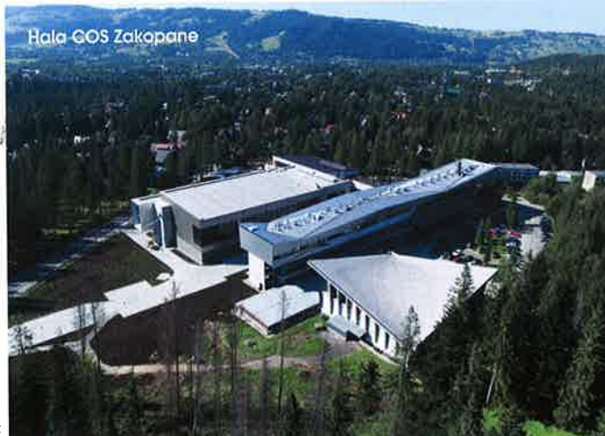
Hala GOS Zakopane

wnętrznych, remont pomieszczeń wewnątrz ośrodka. Z kolei projekt budowy toru łyżwiarskiego Stegny przy ul. Inspektowej 1 ubiega się o dotację. W ramach modernizacji Ośrodka Stegny planowane jest zadaszenie i duża przebudowa toru na kryty wielofunkcyjny kompleks sportowo-rekreacyjny, z widownią dla 3–12 tys. widzów. Obiekt ma być przystosowany do uprawiania łyżwiarstwa szybkiego, hokeja, łyżwiarstwa figurowego, curlingu, short-tracku. Szacunkowa wartość inwestycji to 160 mln zł. Z kolei dla projektu modernizacji Ośrodka Polonia przy ul. Konwiktorskiej w Warszawie wybrano generalnego wykonawcę hali basenowej. Najkorzystniejszą ofertę złożyła firma Decor Stucco Zenon Szczygieł. Kompleks przejdzie modernizację hali basenowej wraz z podbase-niem oraz zapleczem szatniowo-sanitarnym. Prace remontowe zostaną przeprowadzone również w sali gimnastycznej. Pierwsza faza inwestycji obejmuje modernizację bocznego boiska ze sztuczną nawierzchnią, do którego zostanie dobudowany budynek z szatniami i sanitariatem. Z końcem maja br. podpisano umowę na modernizację Ośrodka Całoroczny Stok Narciarski Szczęśliwice. Wykonawca – firma KBUD Krzysztof Łuksza ma 110 dni na wykonanie prac remontowych w budynku głównym ośrodka. W grupie planowanych przez Stołeczne Centrum Sportu Aktywna Warszawa inwestycji są cztery projekty. Poza wspomnianą modernizacją Ośrodka Namysłowska w planach jest szacowana na 20 mln zł przebudowa