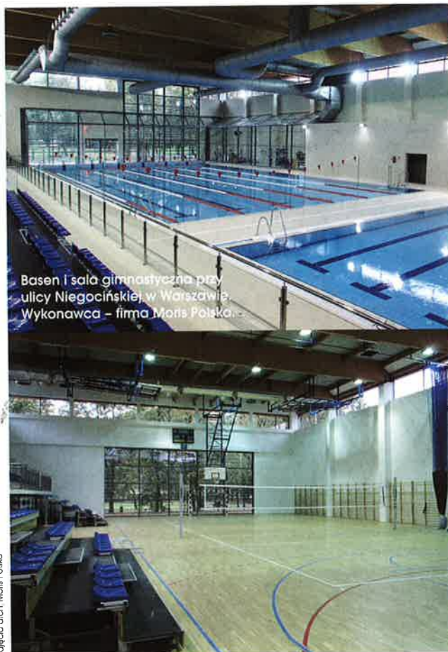
Basen i sala gimnastyczna przy ulicy Niegocińskiej, w Warszawie. Wykonawca – firma Moris Polska.

Inwestycją godną uwagi jest zakończona w czerwcu br. budowa basenu i sali gimnastycznej przy ulicy Niegocińskiej w Warszawie. Wartość robót to prawie 19 mln zł. Wykonawca – firma Moris Polska – zrealizował obiekt, połączony łącznikiem z budynkiem szkoły, składający się z dwóch hal. W jednej z nich przewidziano basen z sześcioma torami o wymiarach 25x16,08 m i mniejszą nieckę do nauki pływania. W części basenowej znajdują się trybuny na ok. 220 osób. Druga hala zawiera boisko do koszykówki, dwa boiska do siatkówki i dwa boiska do mini koszykówki. Na trybunach znalazło się 358 miejsc siedzących. Na zewnątrz obiektu powstało boisko do piłki nożnej i ręcznej o nawierzchni z trawy syntetycznej oraz boisko do koszykówki i siatkówki.