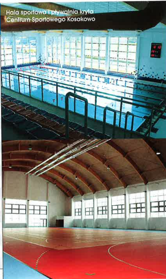
Hala sportowa i pływalnia kryta Centrum Sportowego Kosakowo