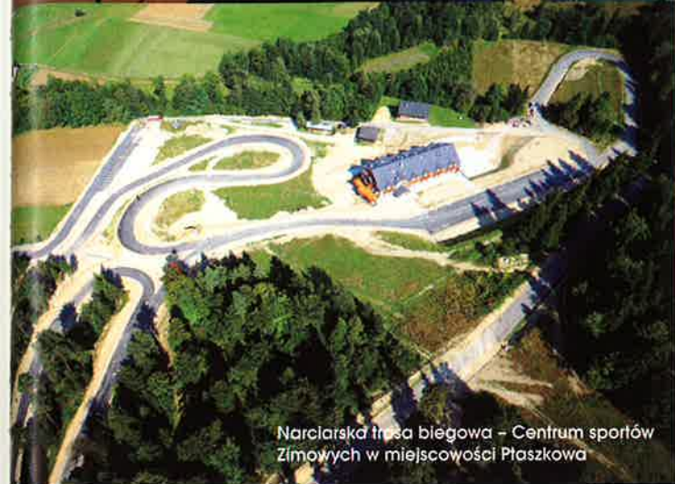
Narciarska trasa biegowa – Centrum sportów zimowych w miejscowości Płaszkowa